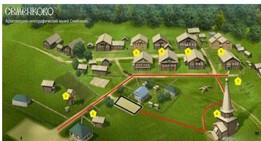
Рис.2. Карта маршрута экскурсии «Деревенская прогулка»